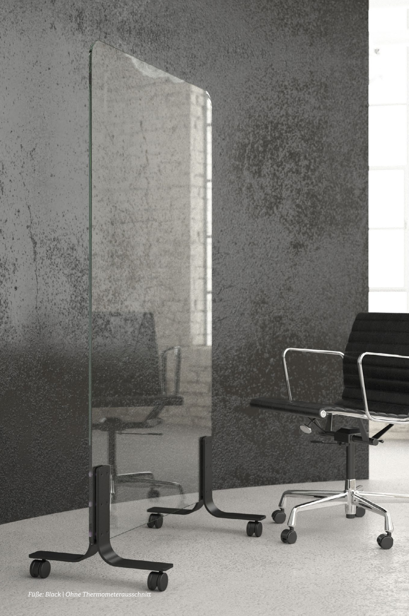
Füße: Black | Ohne Thermometerauschnitt