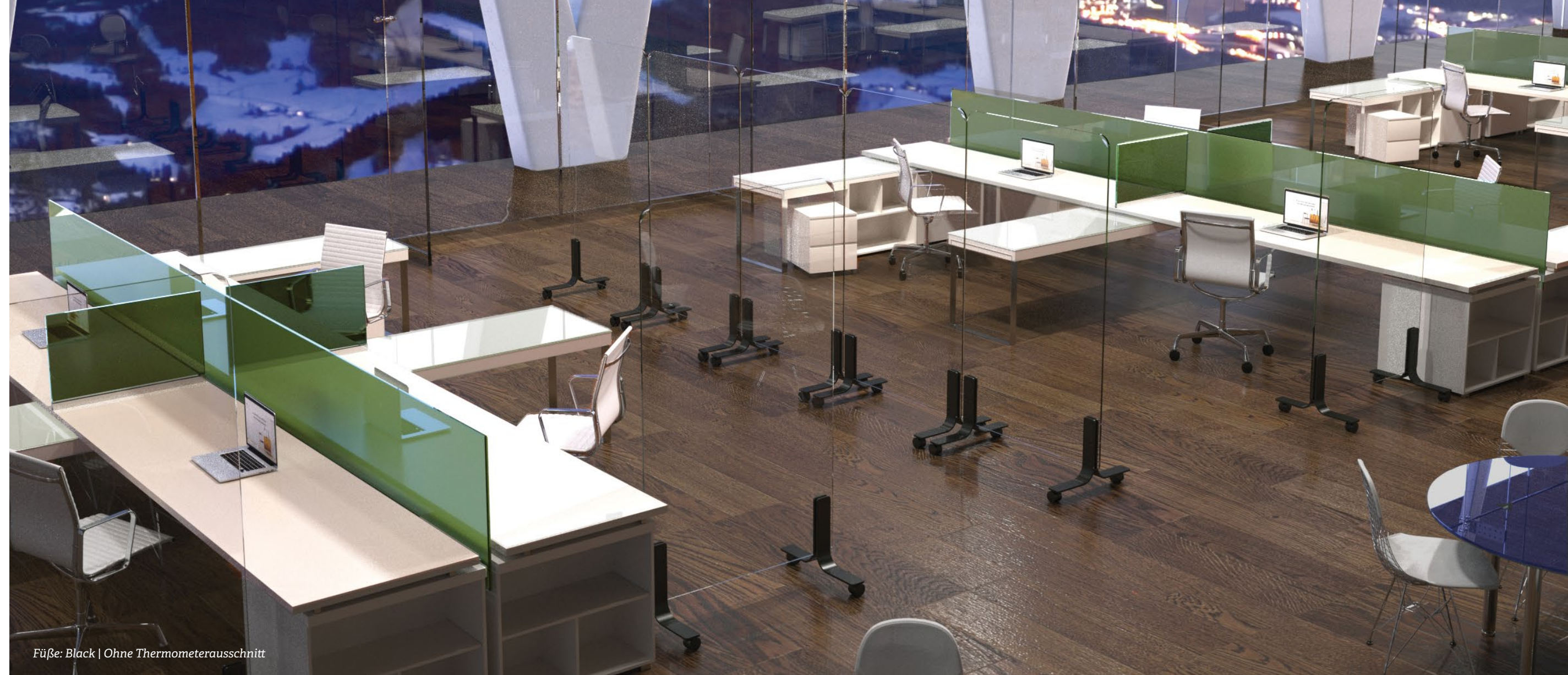
Füße: Black | Ohne Thermometerausschnitt