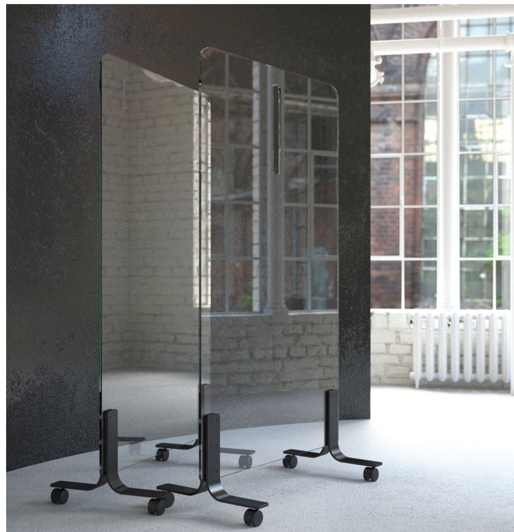
Füße: Black | Mit oder ohne Thermometerausschnitt

be! Clear ist ein innovatives, nicht poröses mobiles Glas-Board, das für viele Einsatzzwecke geeignet ist. Egal, ob Sie einen Schutz gegen die vielen Gesundheitsgefahren der heutigen Zeit, eine Schreiboberfläche für kollaboratives Arbeiten oder einen temporären Raumteiler, der sich unauffällig in das offene Raumkonzept Ihres Großraumbüros einfügt, benötigen: Mit einem be! Clear können Sie sicheren Abstand wahren und dafür sorgen, dass alle gesund bleiben, ohne dass dadurch die Sichtlinie von einem Ende des Raumes zum anderen beeinträchtigt wird. Der optionale Ausschnitt ermöglicht es Ihnen, sichere Temperaturmessungen bei eintreffenden Mitarbeitern, Kunden und Besuchern vorzunehmen sowie wichtige Dokumenten durch eine leicht zu desinfizierende Barriere zu reichen – und trotzdem sind alle geschützt. Dank der natürlichen Eigenschaft von Glas sind bei be! Clear Sicherheit und Mobilität perfekt in einer Lösung vereint.