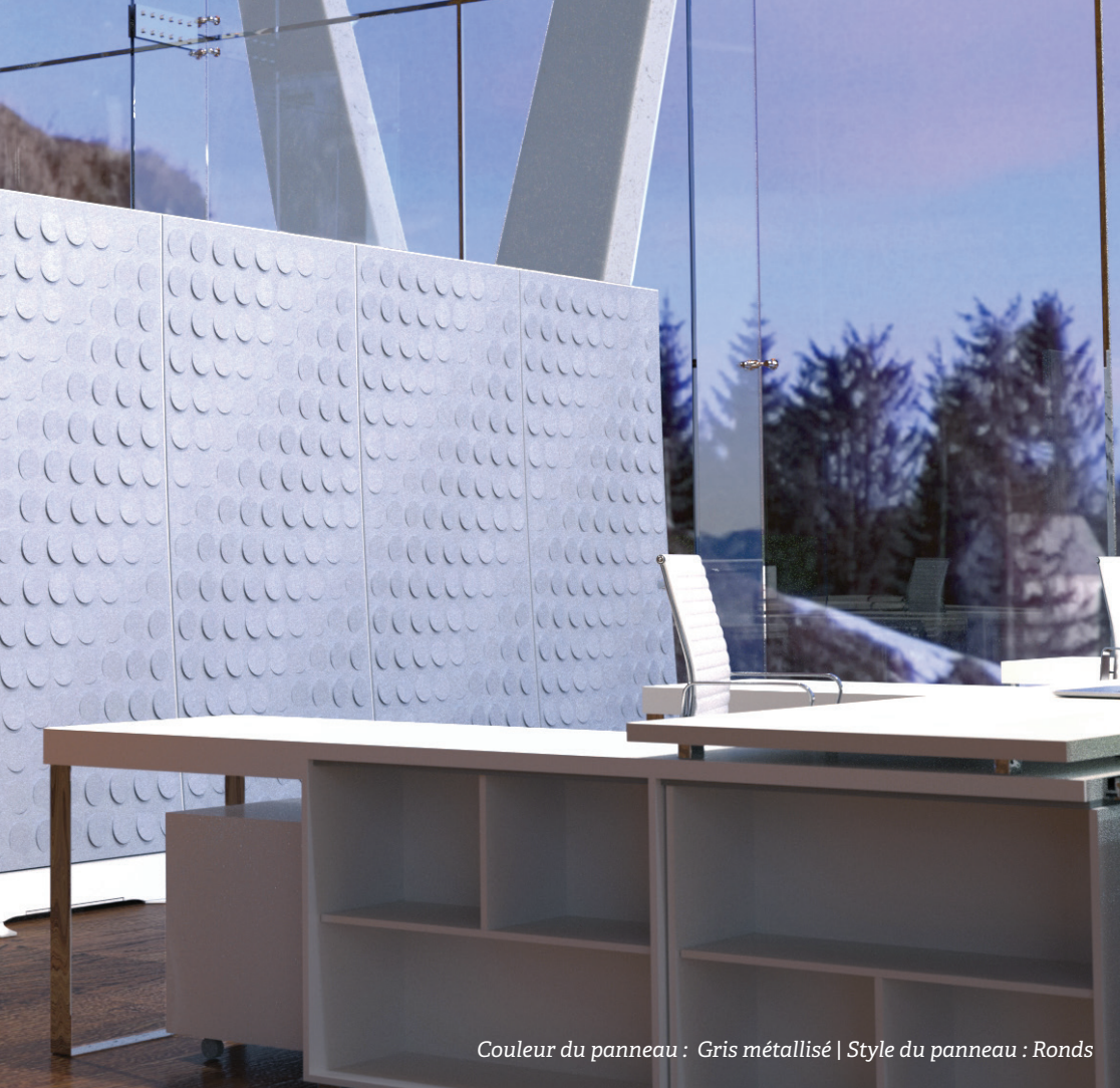
Couleur du panneau : Gris métallisé | Style du panneau : Ronds